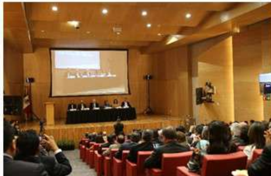
I Reunión Comité Rector del SNF Ciudad de México, 7 de junio

Asesorar y brindar acompañamiento a las Coordinaciones Regionales para el cumplimiento de sus atribuciones y de los acuerdos que así lo demanden.