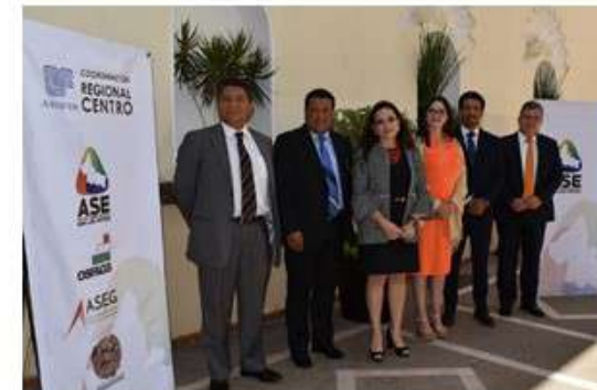
Primera Reunión Coordinación Regional Centro San Luis Potosí, 24 de agosto