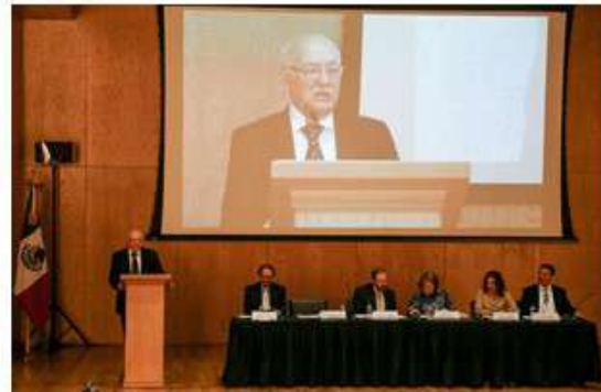
I Reunión Plenaria del SNF Ciudad de México, 8 de junio