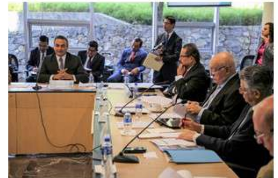
Reunión con Coordinadores Regionales de ASOFIS Ciudad de México, 18 de julio

Asociación Nacional de Organismos de Fiscalización Superior y Control Gubernamental A.C. Coordinación Nacional