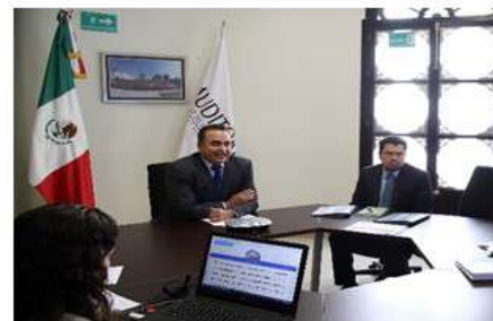
Primera Reunión Coordinación Regional Centro Pacífico virtual, 21 de septiembre