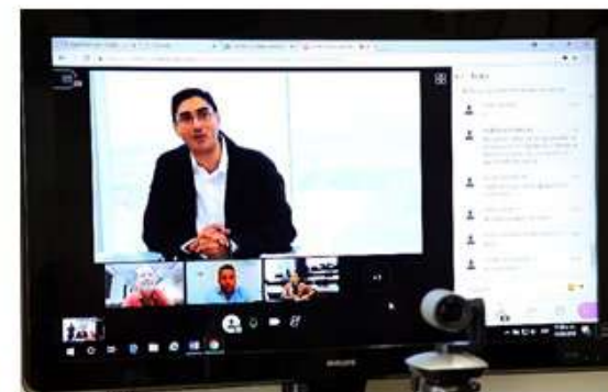
Primera Reunión Coordinación Regional Sureste virtual, 11 de septiembre