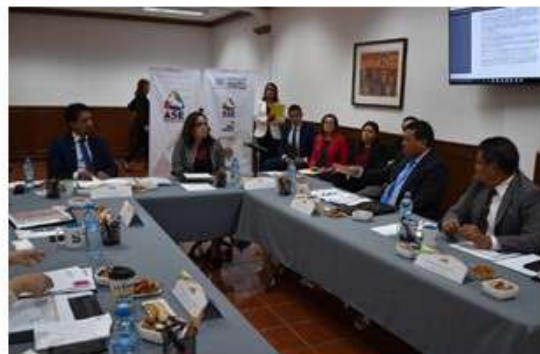
Primera Reunión Coordinación Regional Centro Golfo Campeche, 25 de mayo

Asesorar y brindar acompañamiento a las Coordinaciones Regionales para el cumplimiento de sus atribuciones y de los acuerdos que así lo demanden.